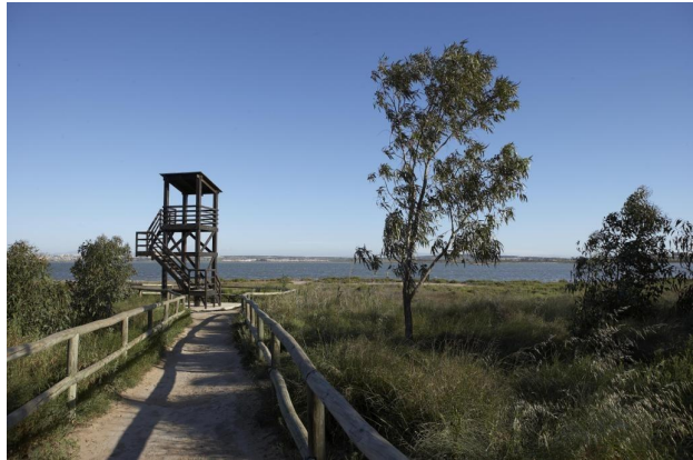
Imagen informativa sin escala / Informative image not scaled and subject to changes. Se reserva el derecho de modificaciones por motivos técnicos, jurídicos o comerciales.